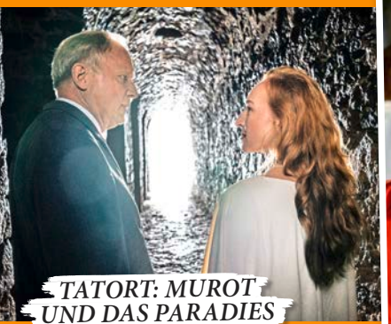
TATORT: MUROT UND DAS PARADIES

KRIMI Kommissar Murot (Ulrich Tukur) ist von der verführerischen Eva (Brigitte Hobmeier) fasziniert